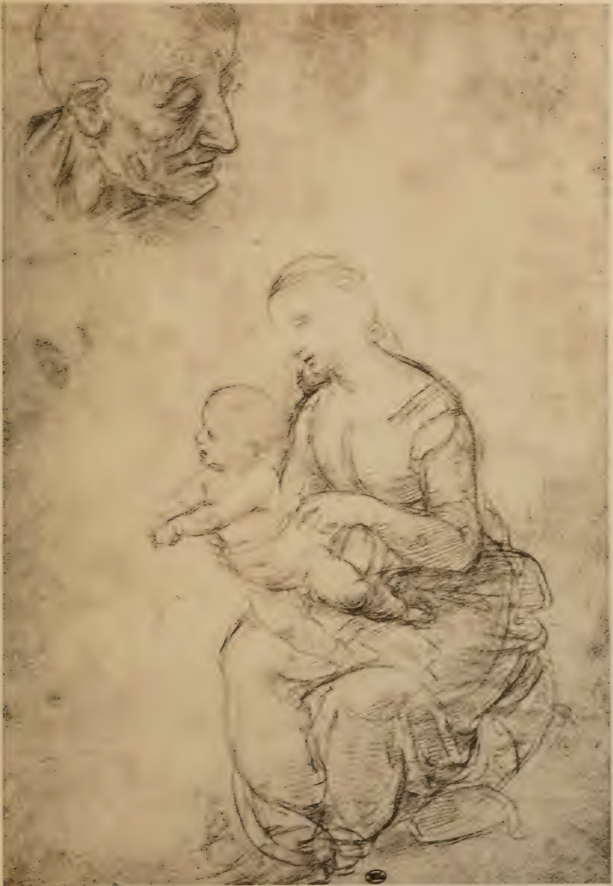
Etude pour la Vierge au Palmier